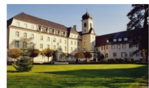
Das Malterschloss Heitersheim