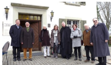
Nach der Sitzung im Kloster Fahr