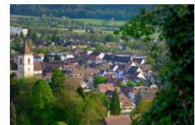
Das Städtchen Staufen im Breisgau

Das definitive Programm finden Sie in der Beilage.