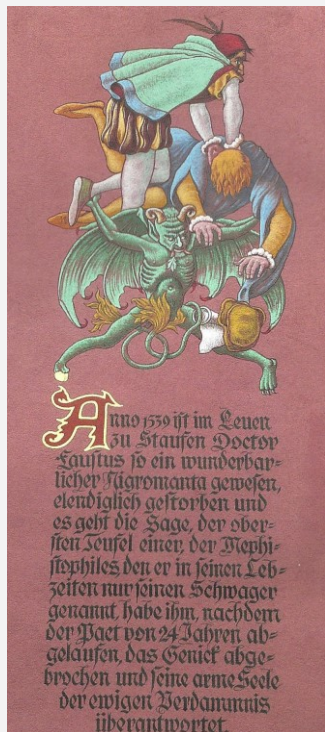
Wandbild zur Faustsage am Gasthaus Löwen, Staufen