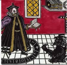
Dr. Faustus und der Teufel (Frontispiz zu Christopher Marlowes Drama, 1620).