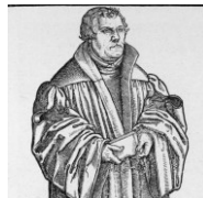
Martin Luther (1483–1546)

Das Lutherjahr – 500 Jahre Reformation – bietet Gelegenheit, die Haltung der beiden Zeitgenossen, Paracelsus' und Luthers, zu vergleichen.